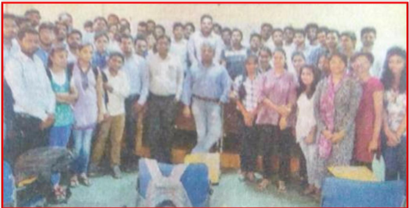
Figure 17 Industry Academia Interface