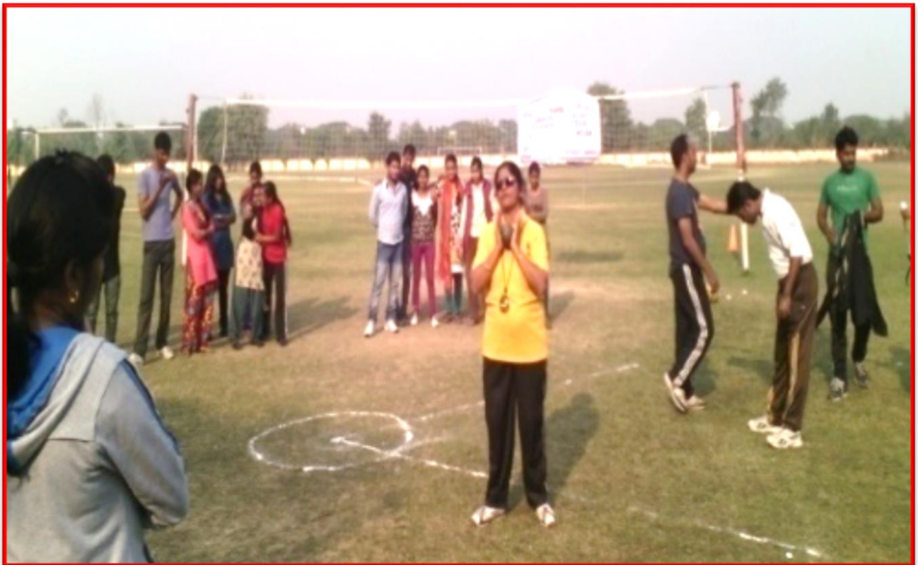
Figure 1 Community Coaches Training Program

Details of the Program: Department of Social Work and 'Special Olympic Bharat' organized a Community Coaches Training Program; the program was sponsored by Ministry of Youth Affairs & Sports, Govt. of India. The objective of this training was to train special children in different games and make them feel proud that they are also giving their contribution to make this country bright