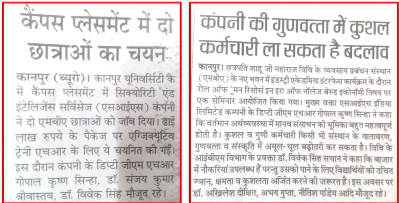
Figure 18 Placement Drive

Organized a Placement drive and lecture for MBA institute of Business Management, CSJM University, Kanpur.