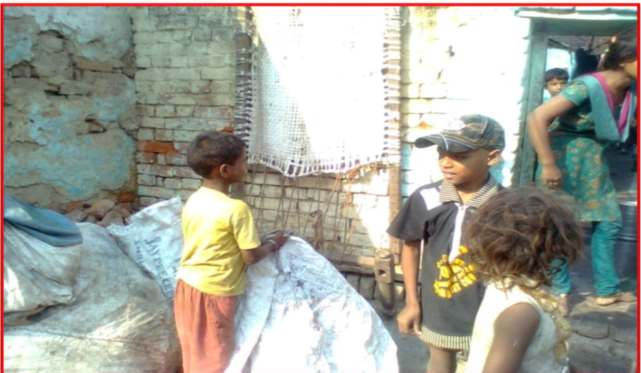
Figure 10 Worked with Trash Dealers surrounding Kanpur