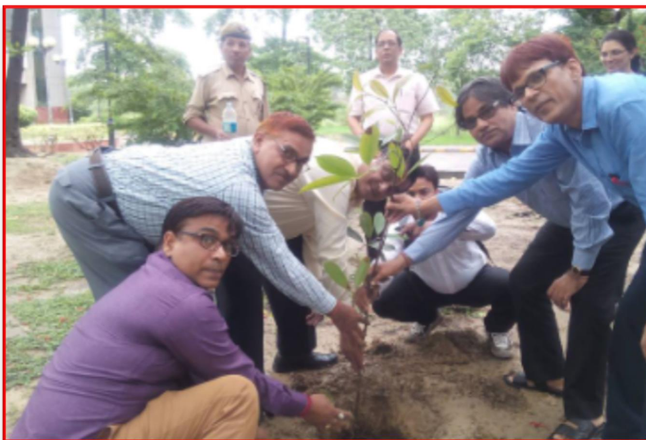
Figure 16 Tree Plantation Drive

Organized Plantation Drive on 5/7/17 By NSS Unit 3rd at CSJM University, Kanpur.