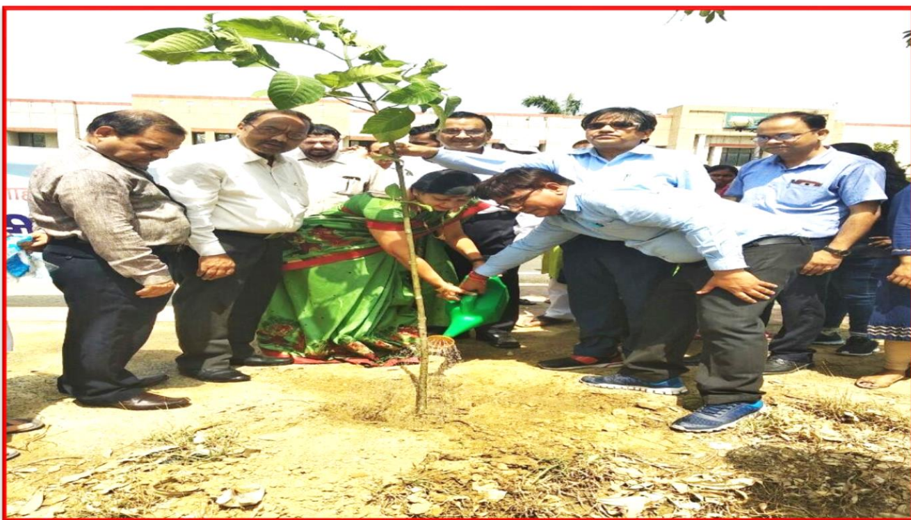
Figure 28 Plantation Programme