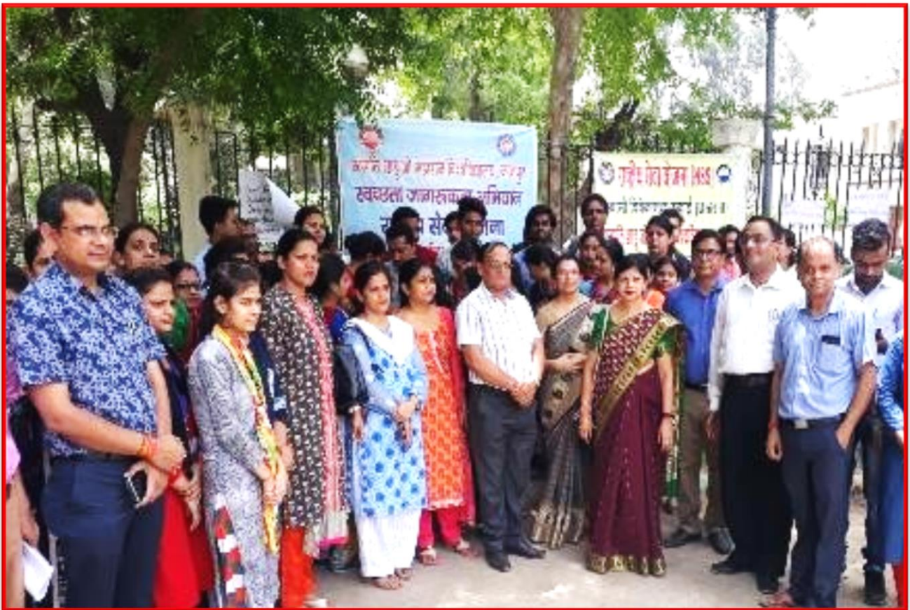
Figure 29 Swachhata Abhiyan