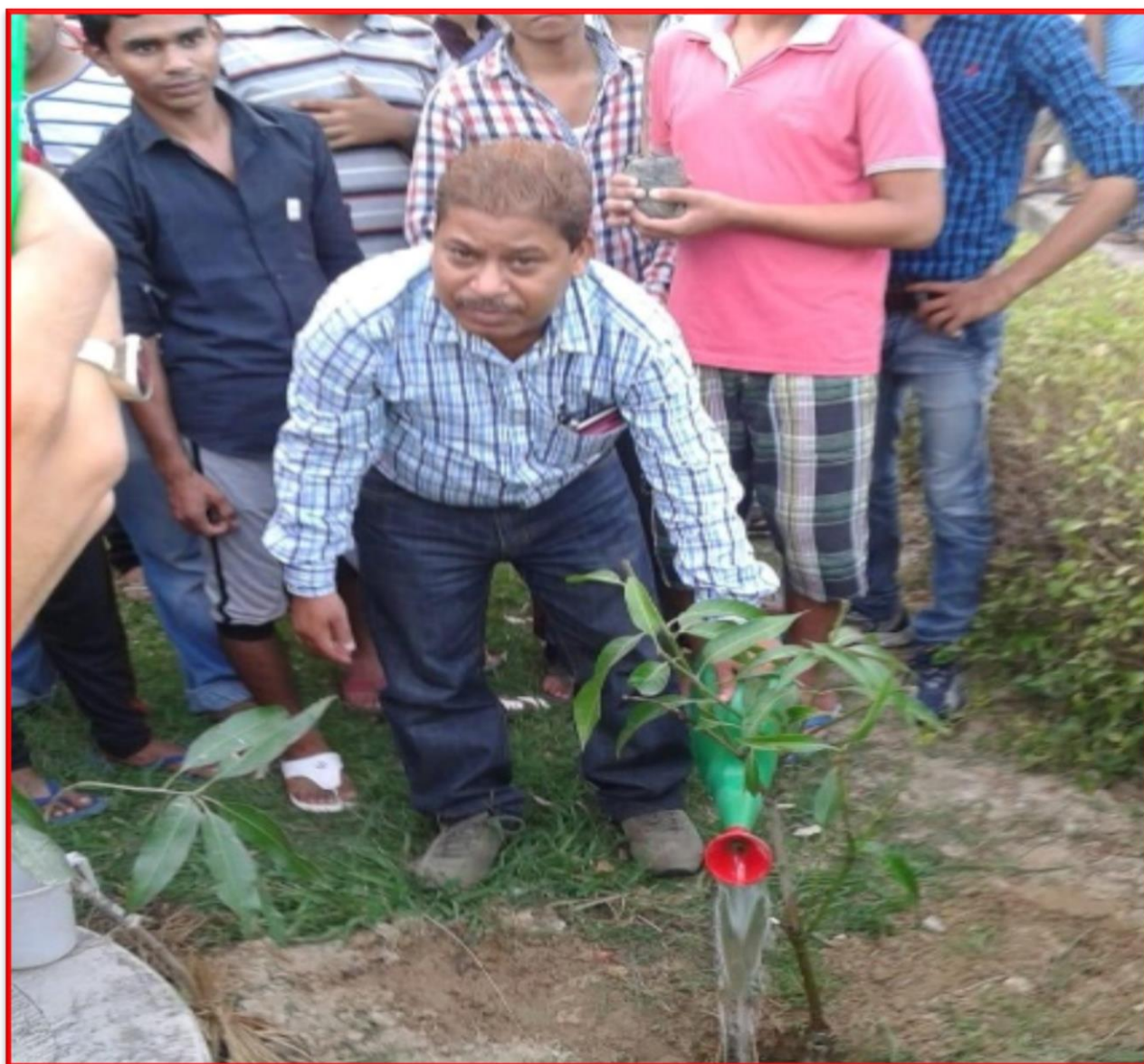
Figure 15 Tree plantation Drive

Feb 22, 2018: Tree plantation Drive in hostels_ 72 students participated in the event.