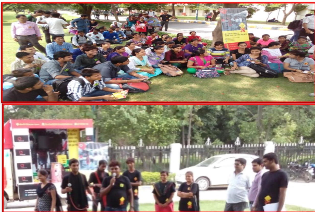
Figure 11 Skill Building on “Bell Bajao Abhiyaan”

Details of the Program: The Department of Social Work, CSJM University Kanpur and Breakthrough organization collaboratively conducted a skill building workshop on “Bell Bajao Abhiyaan” with the students of Master of Social Work and other departments. In this workshop, the students were trained on the act and laws related to women and how the women can save them from the unfavorable situations; in that situation they will have to do just make some noise so the people of surrounding can help them.