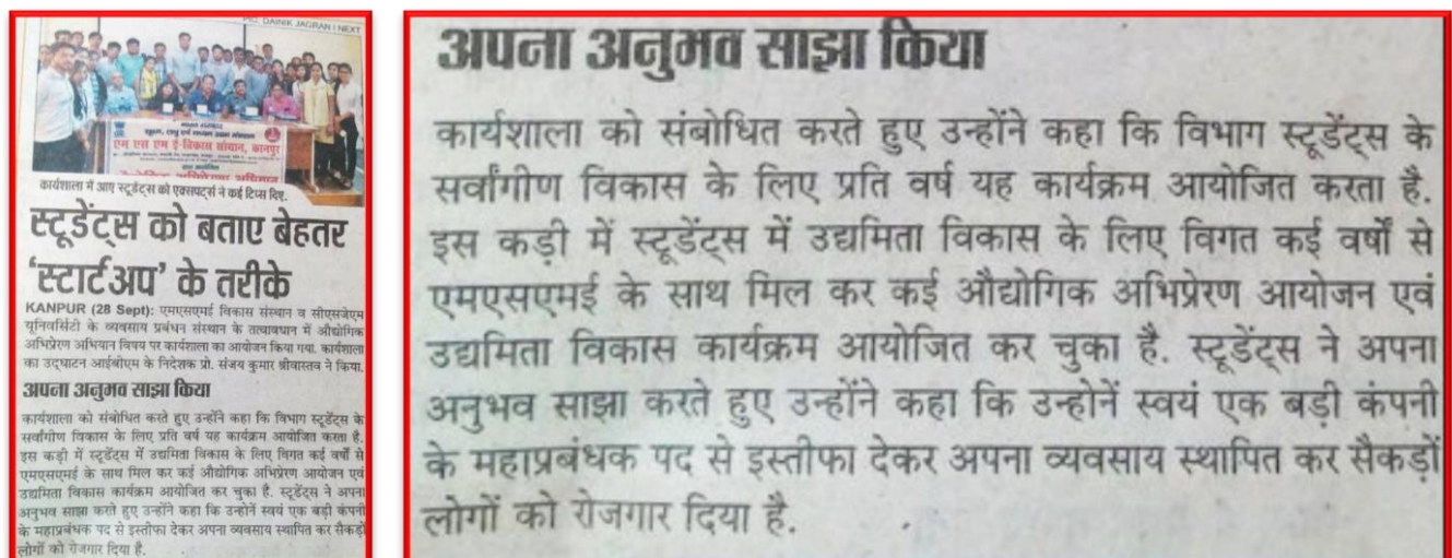
Figure 19 Industrial Motivation Campaign

Organized One day: Industrial Motivation Campaign" in collaboration with MSME DI Kanpur.