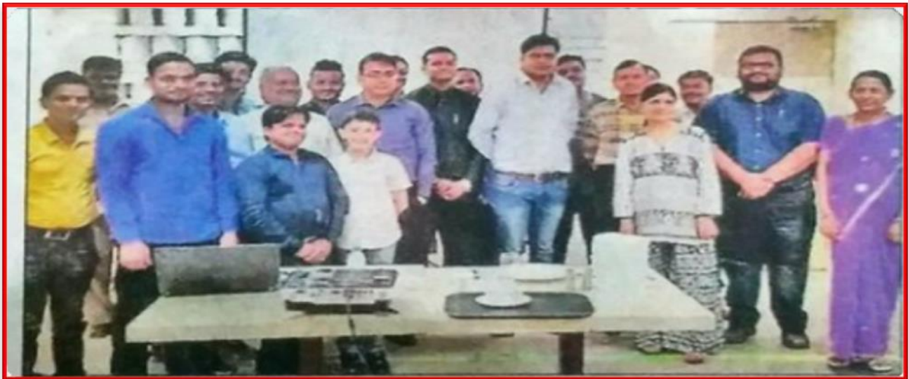
Figure 22 Table Tennis in Canteen