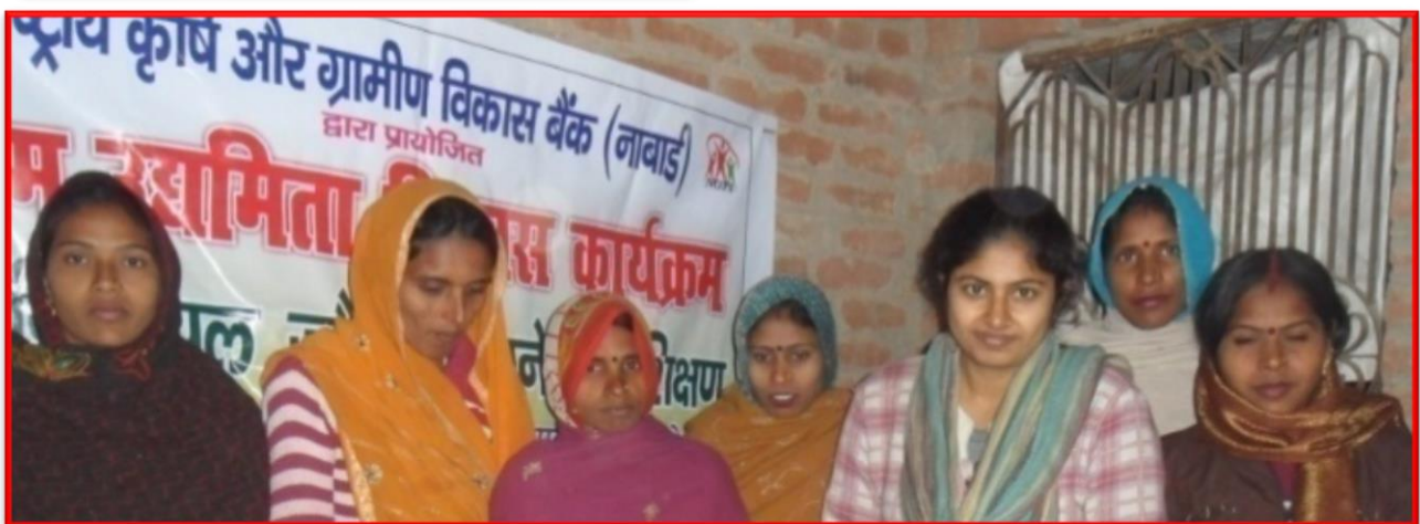
Figure 5 Micro Entrepreneurship Development Programme