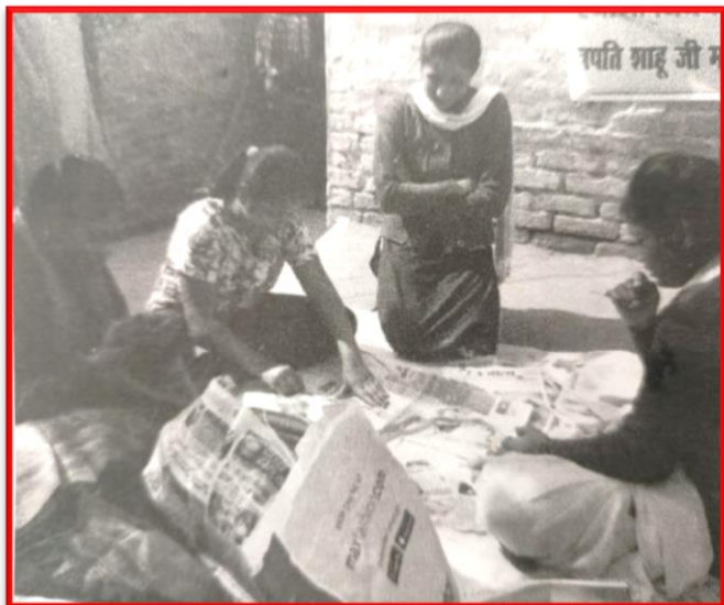
Figure 24 Entrepreneurship Workshop