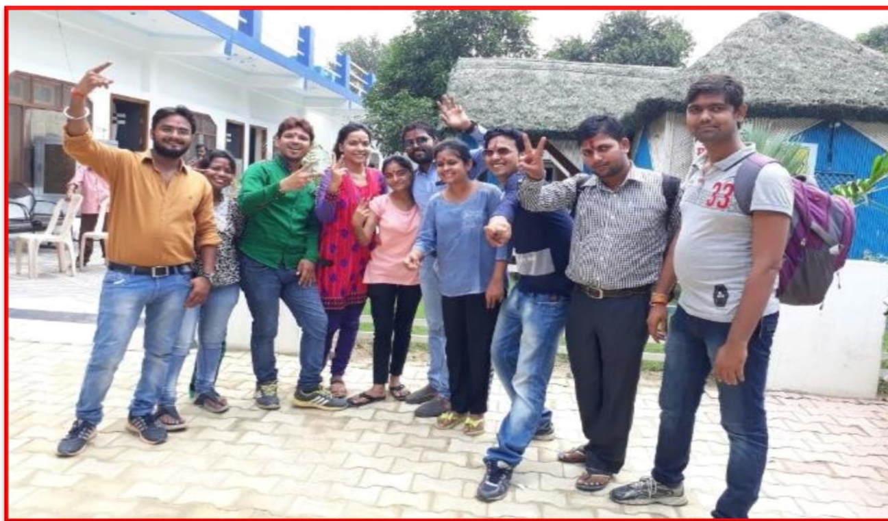
Figure 14 ‘Samuday’ Project

Details of the Program: Group of 15 students selected for the 60 days monitoring program in the month of June and July’ 2018 with HCL Foundation. Our students worked there as a Field Monitor in ‘Samuday Project’ ran by HCL Foundation and monitored by John Hopkins University, USA at Hardoi. They were mainly responsible for monitoring of baseline surveys which was being done by the field surveyors of ‘Kantar - IMRB International organization’. The survey was on Community development, which included Open Defecation Free, Sanitation, Cleanliness, Maternal Health, Child Health, Livelihood and Educati.