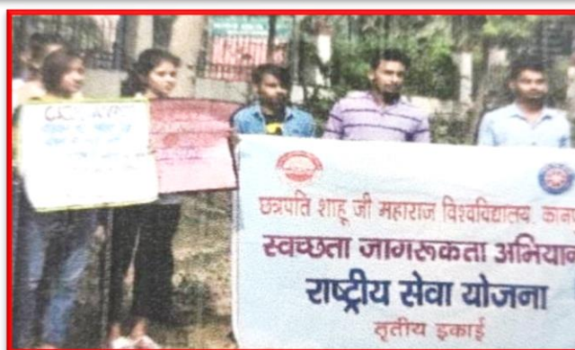
Figure 26 Polythene-Free Awareness Campaign