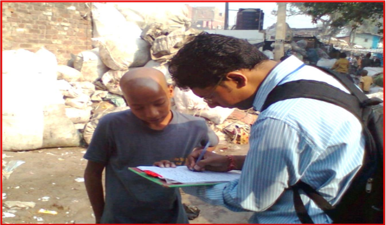
Figure 9 Worked with Trash Dealers surrounding Kanpur