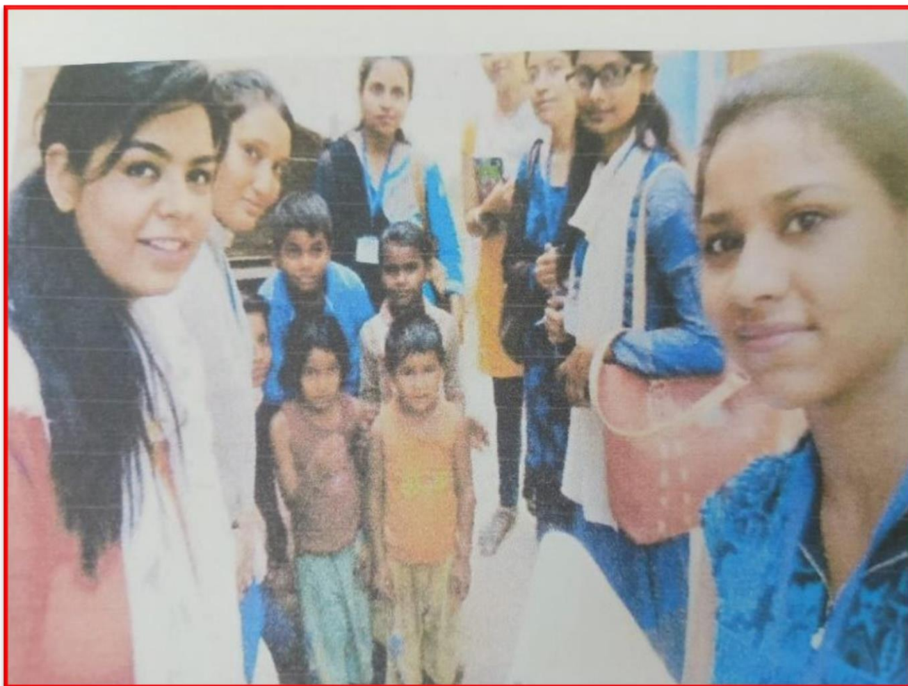
Figure 25 Primary Health Check-up

Details of the Program: शिक्षा विभाग के विद्यार्थियों एवं एनव्एसएसएस स्वयंसेवक, छत्रपति शाहू जी महाराज विश्वविद्यालय, कानपुर द्वारा दिनांक 11 मार्च 2018 को आयोजित “प्राथमिक स्वास्थ्य परीक्षण” के माध्यम से बच्चों की प्राथमिक स्वास्थ्य जाँच की गयी तथा उन्हें प्रतिदिन दांतों की सफाई करने, स्नान करने और साफ सुथरे कपड़े पहनने के लिए प्रेरित किया गया।