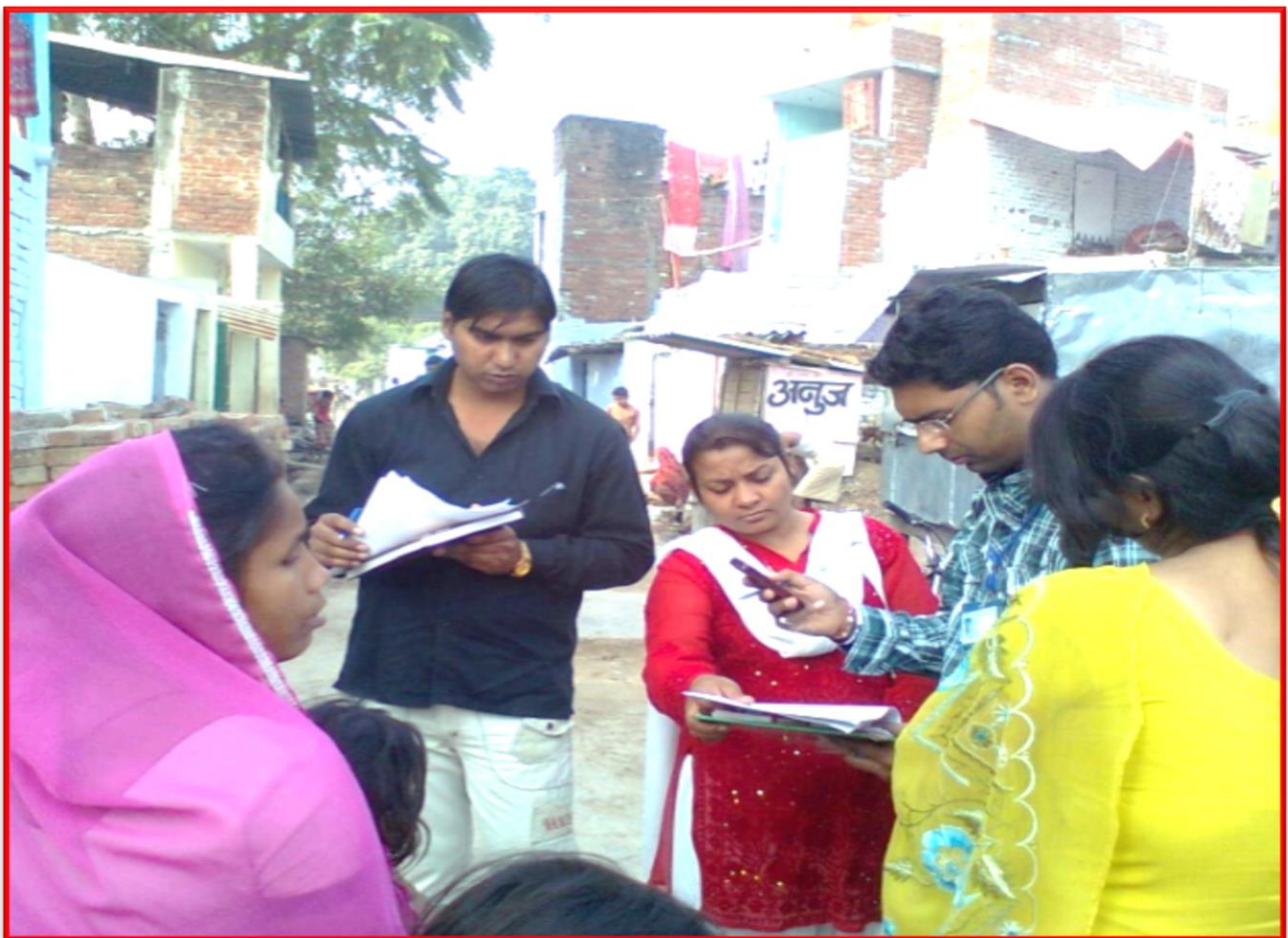
Figure 8 Worked with Trash Dealers surrounding Kanpur

Details of the Program: The students of Department of Social Work have Worked with Trash dealers and Rag pickers on behalf of Nagar Nigam and A2Z Infra. Ltd. So, we got to know the problems they are facing and how can they support municipal corporation to make this city clean.