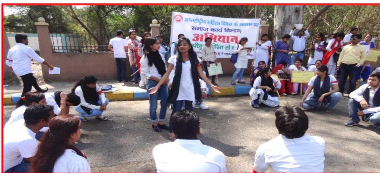
Figure 12 Campaign on #askingforit

Details of the Program: On the occasion of International Women's Day, the Department of Social Work, CSJM University Kanpur and Breakthrough organization collaboratively conducted a Campaign on #askingforit on Sexual Harassment, PWDV Act with the students of Master of Social Work. This campaign was the successor of the workshop on "Bell Bajao Abhiyaan", where the students were trained on the act and laws related to women and how the women can save them from the unfavorable situations. The campaign was followed by Rally and Street Play at Asha Devi Temple, Kalyanpur; in this play students circulated the message to community that they must be stood up against their sexual harassment and domestic violence.