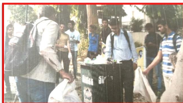
Figure 27 Cleanness Awareness Campaign