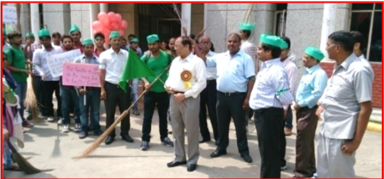
Figure 6 Clean India Campaign

Details of the Program: Clean India Campaign was driven by the Department of Social Work in the campus of CSJM University Kanpur. In this rally, students gave the message on clean India and clean campus.