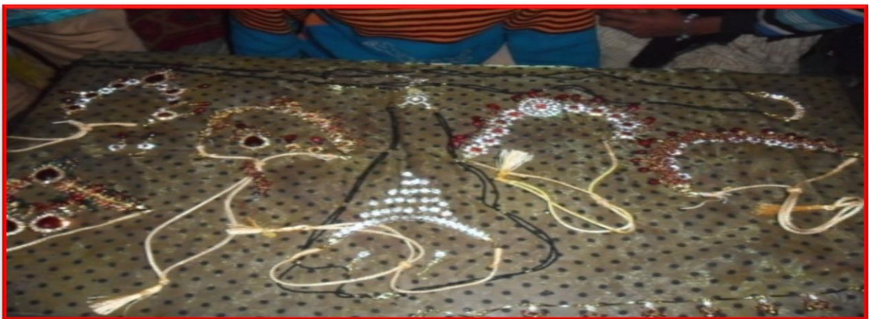
Figure 4 Jewellery Making Training Program