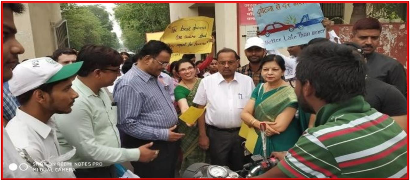
Figure 30 Traffic Rule Awareness Programme

इस अवसर पर स्वयंसेवको ने हेलमेट न लगाने वाले और सीट बेल्ट न लगाने वाले लोगो को गुलाब का फूल देकर यातायात नियमों का पालन करने के लिए प्रेरित किया।