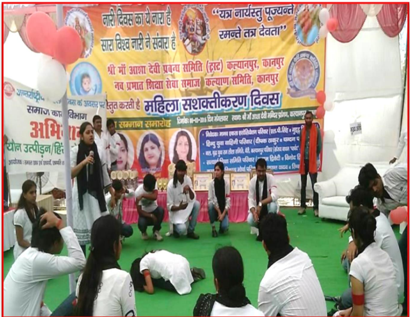
Figure 13 Campaign on #askingforit