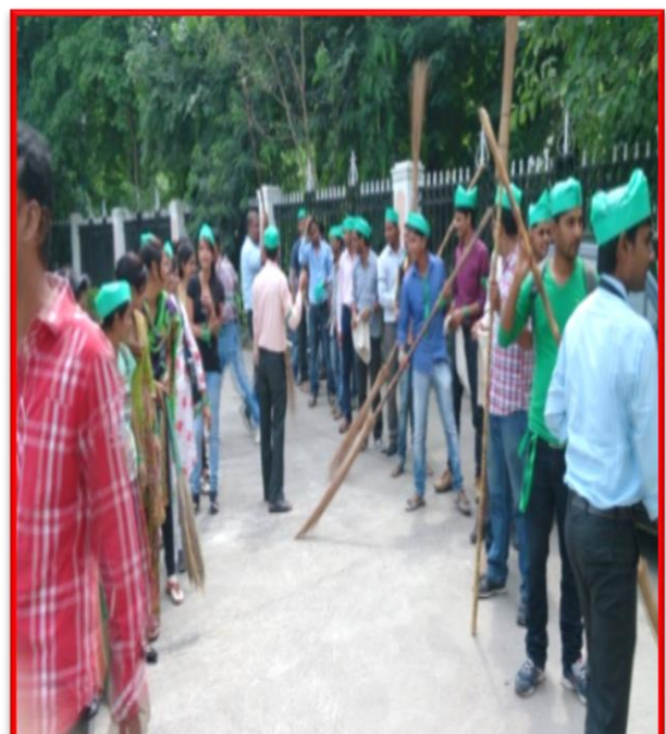
Figure 7 Swachhta Jagrukta Abhiyaan